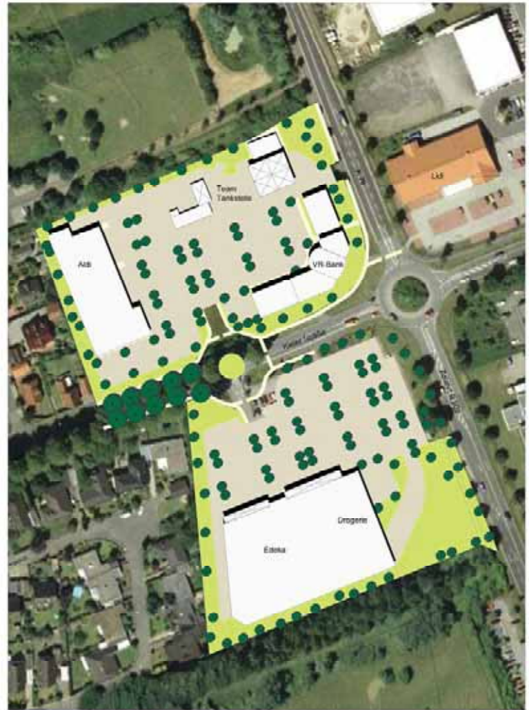
Gemeinde Osterröfnfeld: Lageplan zum Gewerbeareal am Kreisel (Stand: 13.09.2013; M: 1:1.000)