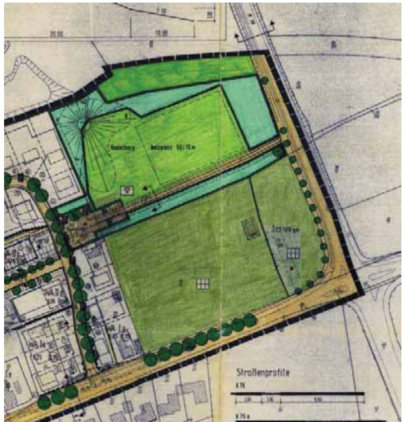
Abb.: Ausschnitt Bebauungsplan Nr. 20

Mit der Aufstellung des Bebauungsplans Nr. 35 ist eine Teilaufhebung des Bebauungsplans Nr. 20 verbunden, da bislang als Kleingartengelände festgesetzte Teilflächen nunmehr überplant werden.