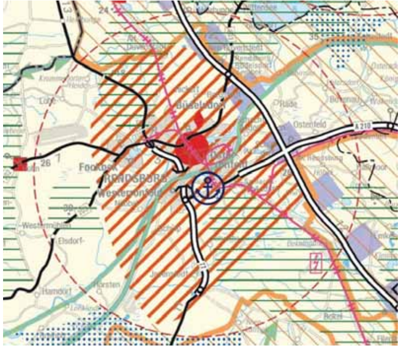
Abb.: Ausschnitt aus dem LEP (2010)