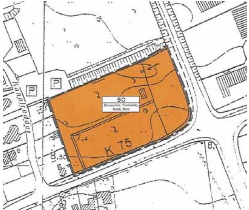
Auszug: 9. Änderung des Flächennutzungsplanes